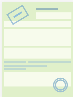
Страховой полис ОСАГО с электронной подписью

После оплаты в ваш личный кабинет и на e-mail придут электронные документы, которые вы можете распечатать: